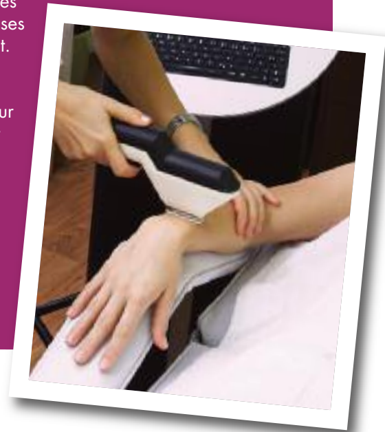
Les taches pigmentaires

Lorsque vous avez des taches brunâtres à quelques endroits sur le corps, il est d'abord et avant tout important qu'elles soient vues par un médecin, surtout si elles ont présenté un changement dernièrement. Votre médecin pourra alors juger de la pertinence d'effectuer une biopsie pour éliminer toutes autres pathologies malignes.